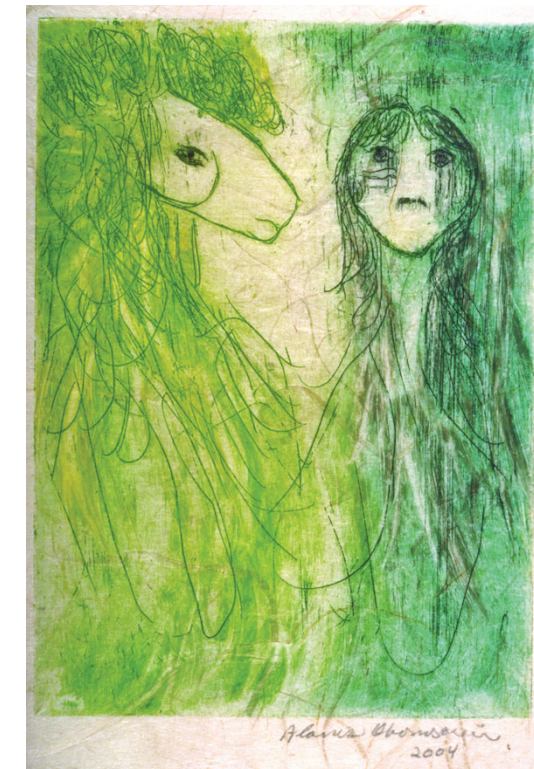
Sans titre (Femme et cheval) , 2004, gravure, taille: 11" X 13"

Open Studio 104 - 401 Richmond St. W. Toronto, Ontario, Canada M5V 3A8 416-504-8238 office@openstudio.on.ca www.openstudio.on.ca Gallery Hours: Tues - Sat, 12 - 5 pm