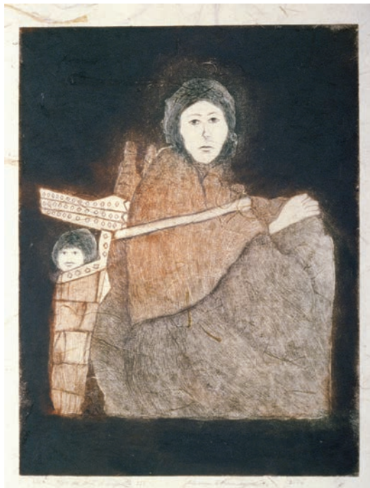
Mère de tant d'enfants III , 2004, etching, image size: 12" x 16"

Open Studio 104 - 401 Richmond St. W. Toronto, Ontario, Canada M5V 3A8 416-504-8238 office@openstudio.on.ca www.openstudio.on.ca Gallery Hours: Tues - Sat, 12 - 5 pm